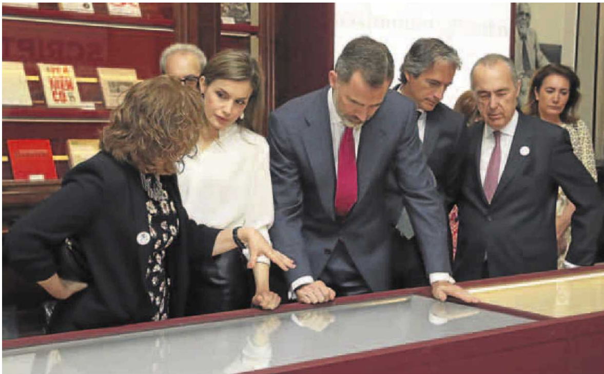
Los Reyes contemplan algunas de las piezas de la exposición.