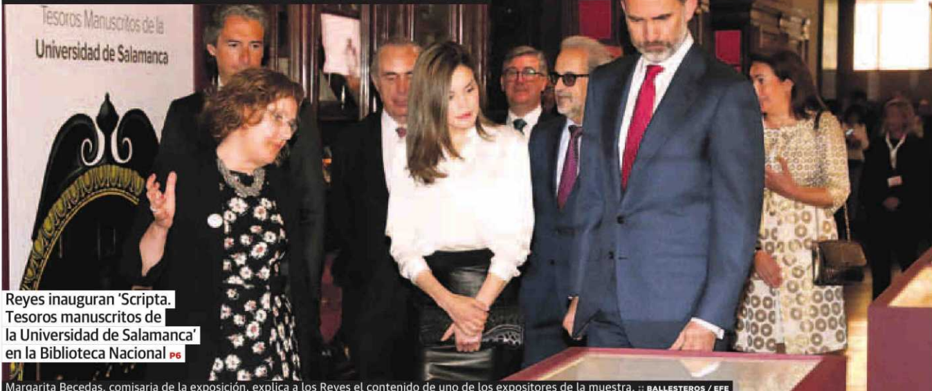
Reyes inauguran 'Scripta. Tesoros manuscritos de la Universidad de Salamanca' en la Biblioteca Nacional P6