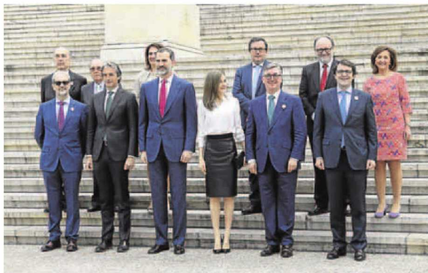
Los Reyes con autoridades universitarias, civiles y de la Biblioteca Nacional.