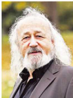
El cineasta Montxo Armendáriz.

El jueves 4, a las 17:00 horas los escritores Jordi Ledesma e Igna-