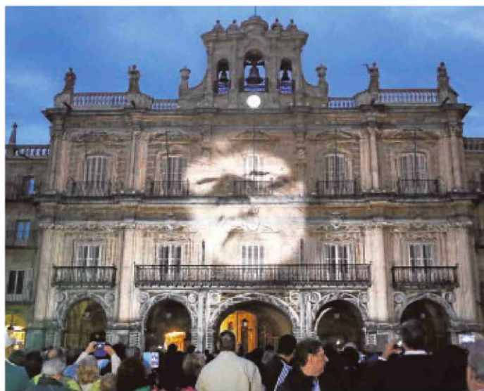
Plaza Mayor Uno de los principales escenarios del festival