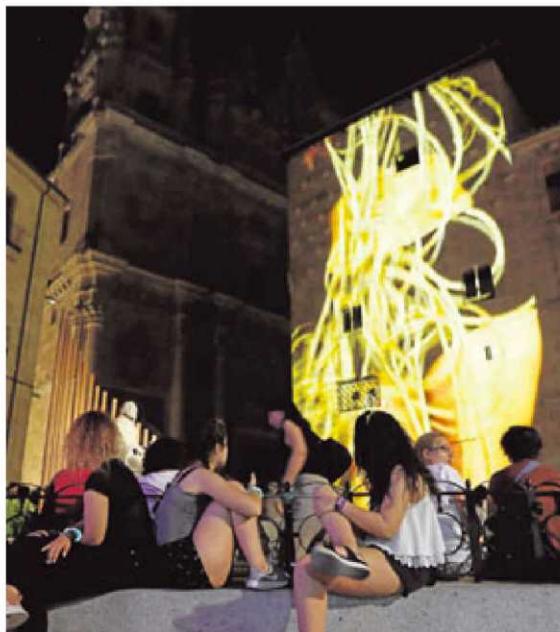
Varias jóvenes contemplan la proyección de la Casa de las Conchas.

Minutos antes, en el Casino de Salamanca, el presidente de Iberdrola destacó la coincidencia del Festival con el arranque de los actos del VIII Centenario de la Universidad de Salamanca.