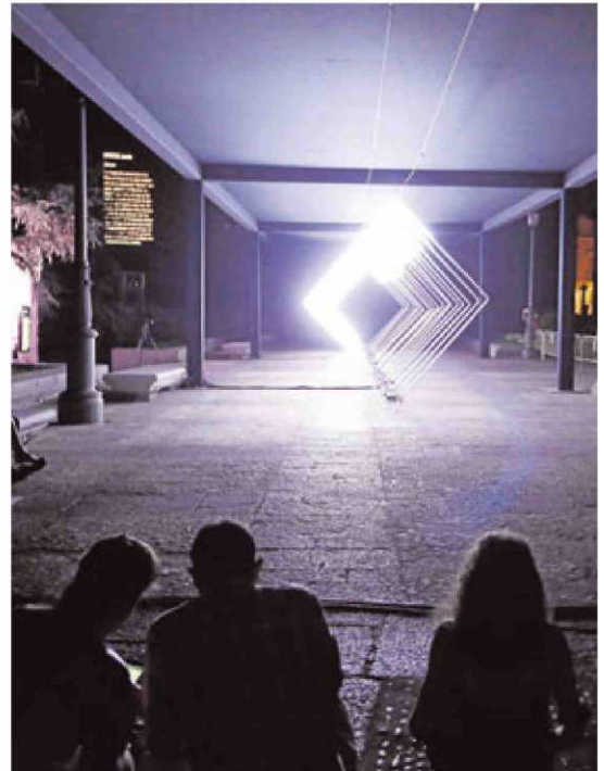
"Narrow", la obra que se exhibe en la plaza de Anaya.