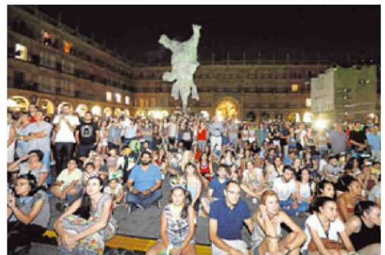
Vista de la Plaza Mayor abarrotada en la noche de ayer.