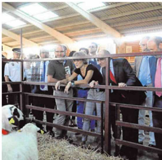
Las autoridades contemplan ovejas churras en la nave de ovino.