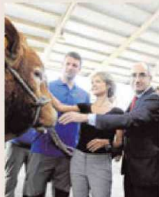
Las autoridades acarician a un toro limusín.

En la feria hay 1.600 cabezas de ganado, de las que 1.100 son ejemplares de vacuno. En Salamanca estos días está la mejor selección de bovino de España y por eso es la cita obligada de los compradores.