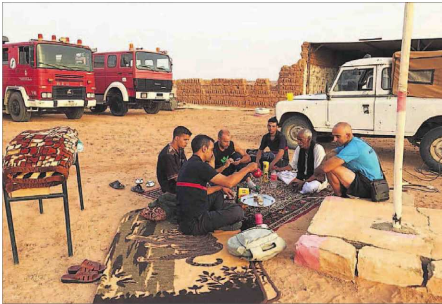
Parque de bomberos de Rabuní.