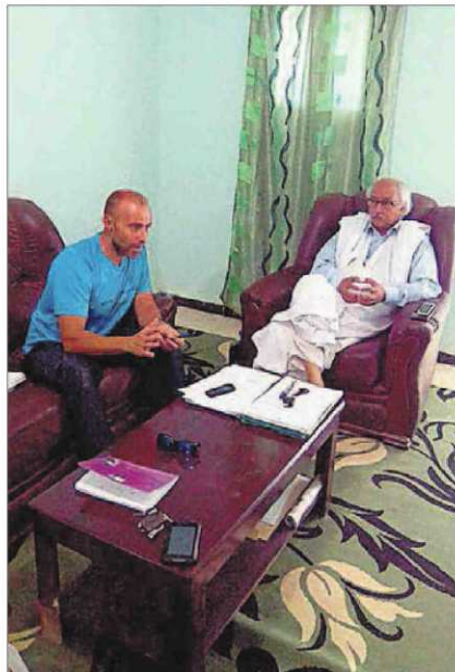
A la izquierda, reunión con el viceprimer ministro del Interior del país. A la derecha, la ONG en el Sáhara con homólogos bomberos.

La agenda de los bomberos contó con una cita oficial con el viceprimer ministro del Interior del Sáhara, el secretario de Interior y bomberos saharauis con el objetivo de valorar el proyecto y