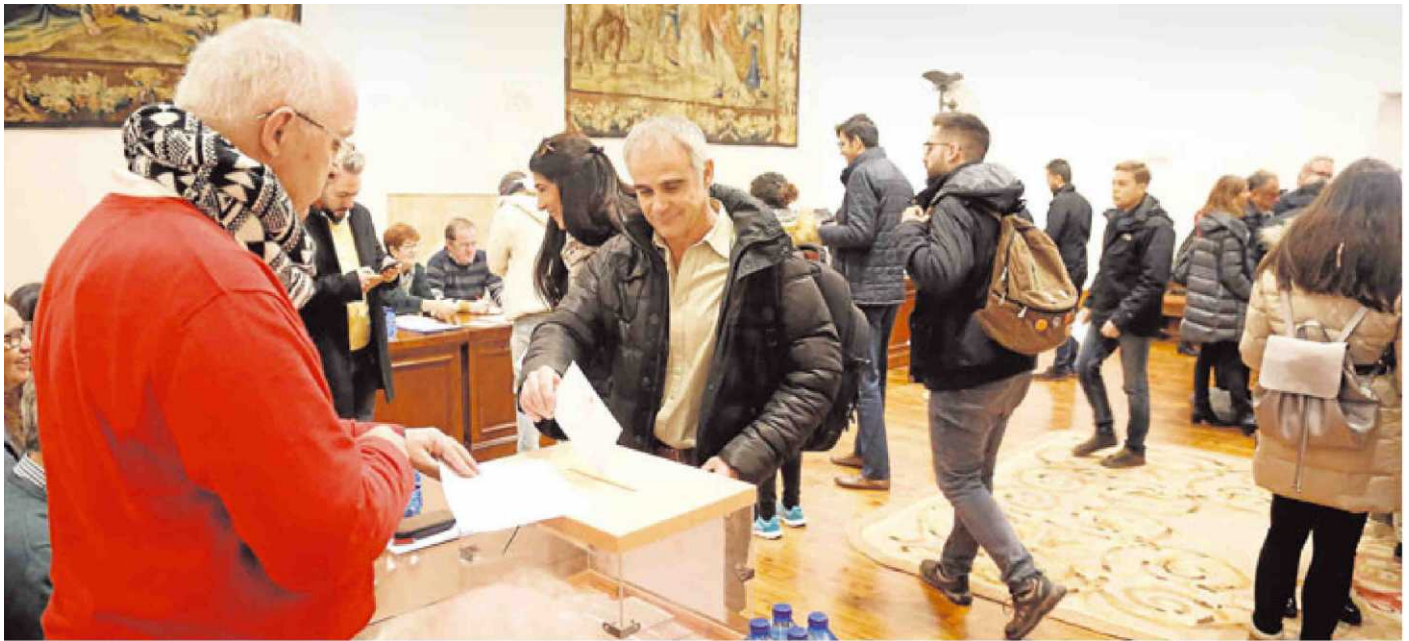
Votantes en las diferentes mesas instaladas en el Edificio Histórico de la Universidad de Salamanca.