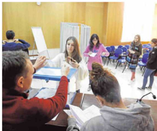
Los alumnos eligen rector en la mesa de Ciencias Sociales.