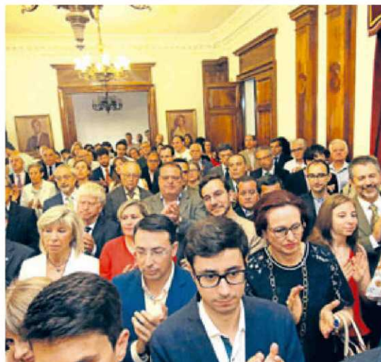
Compañeros del PSOE, familiares y representantes de la sociedad salmantina.