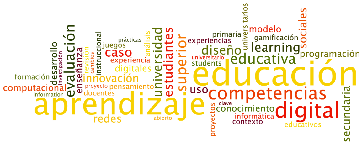
Figura 1. Nube de palabras de términos frecuentes en la segunda etapa de la revista (EKS)