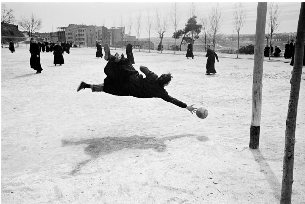
Seminario , Madrid, 1960