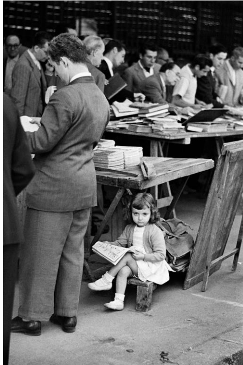
Mercado de San Antonio , Barcelona, 1955