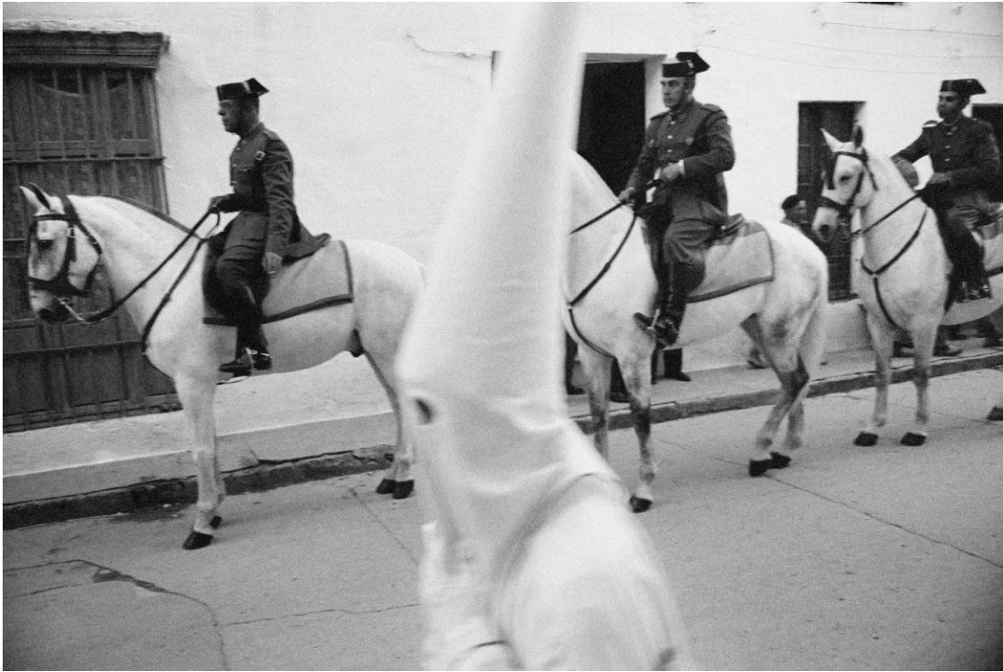
Arcos de la Frontera, Cádiz, 1962