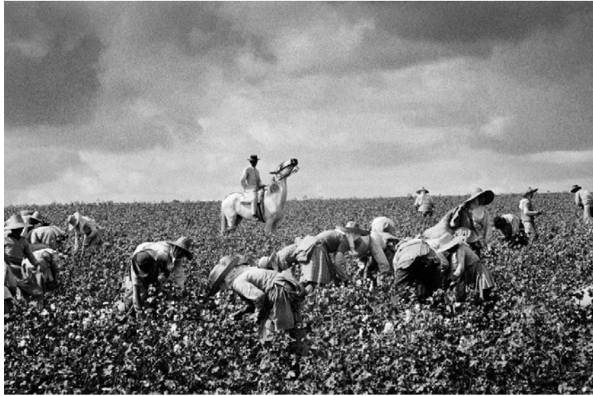
Jerez de la Frontera, Cádiz, 1963 © Ramón Masats, VEGAP, Madrid, 2020