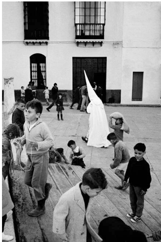
Medina Sidonia, Cádiz, 1959