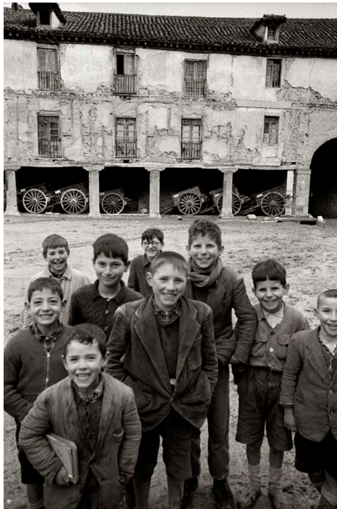
Peñaranda de Duero, Burgos © Ramón Masats, VEGAP, Madrid, 2020