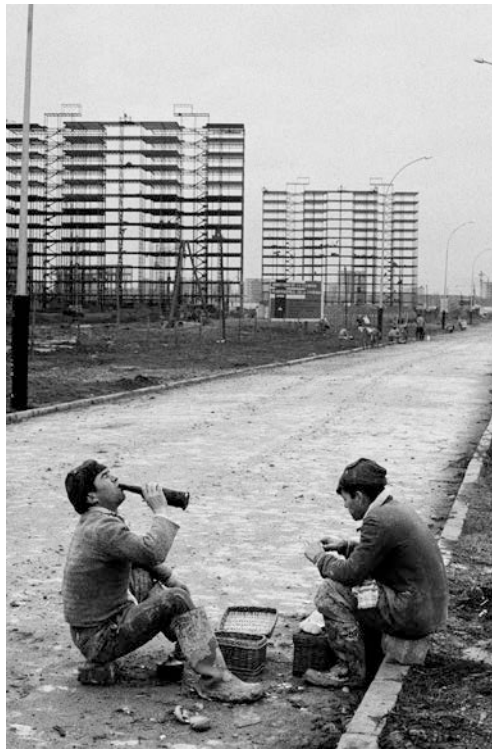
Torremolinos, Málaga, 1957