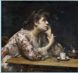
"Dans le bleu" (1894), Amélie Beaury-Saurel