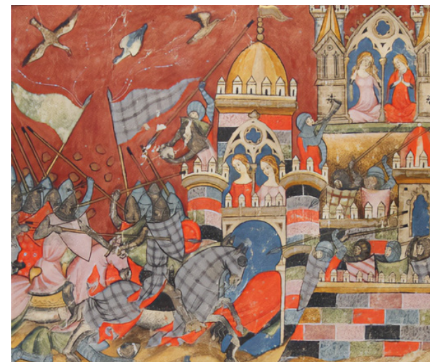
Patrimonio Nacional. Real Biblioteca del Monasterio de El Escorial, RBME h-1-6