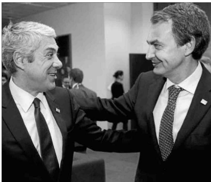
El ex presidente portugués José Sócrates (izquierda) charla con Zapatero pocos días después de su dimisión.

También es bien visto que se acuerden "plenos derechos políticos" a los ciudadanos de cada país residentes en territorio del otro. ■