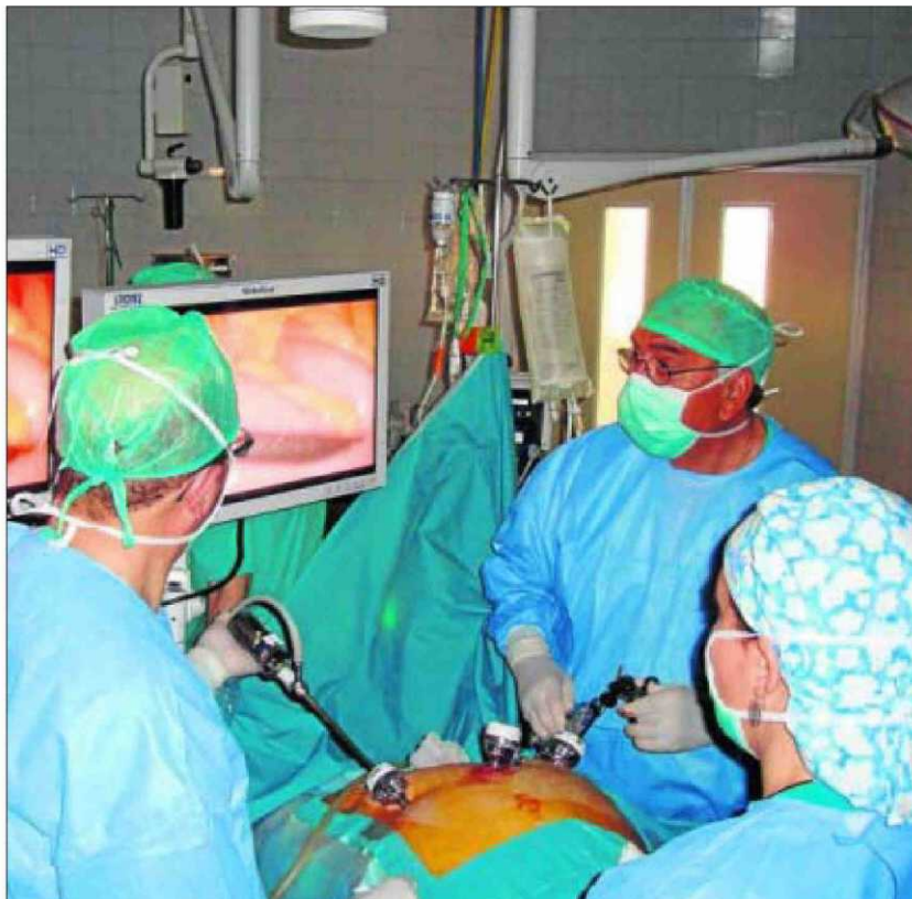
Personal médico durante una intervención en el centro hospitalario de Salamanca.

La extensión de determinadas prestaciones asistenciales será necesaria por el progresivo envejecimiento de la población de Salamanca, uno de los problemas