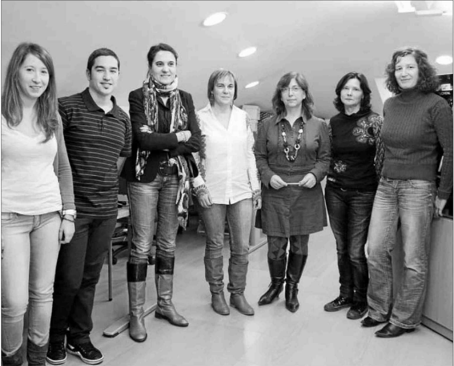
Parte del personal del Servicio de Inserción Profesional, Prácticas y Empleo de la Universidad.