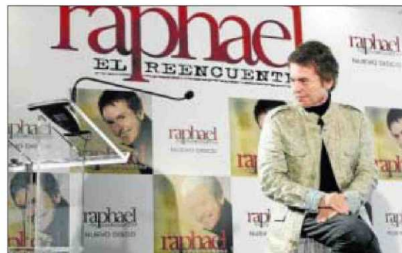
Raphael, en una imagen promocional.