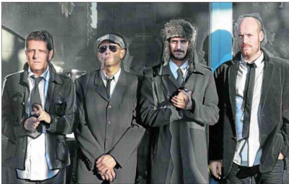
Imagen promocional del grupo Baden Bahl

Las últimas propuestas son la presentación de dos libros ( Ora pro nobis y El punto de partida de la metafísica trascendental , de Carmen Frías y Jacinto Rivera de Rosales), el jueves a las 20 horas en la Casa de las Conchas; y la inauguración de la Feria Municipal del Libro, que arrancará el sábado en la Plaza Mayor. La Feria concluirá el día 13. Una semana para curiosear entre los puestos y ojear las novedades. ■