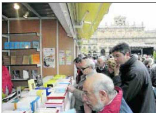
Casetas en la Feria del Libro de 2011.