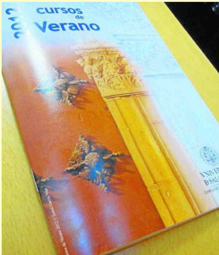
Folleto informativo de los cursos de verano de 2012.

Los interesados pueden entrar en la web, pinchar sobre el nombre del curso que le interesa y ver el precio de matrícula, las horas, las fechas y el número de plazas de cada uno de los cursos.