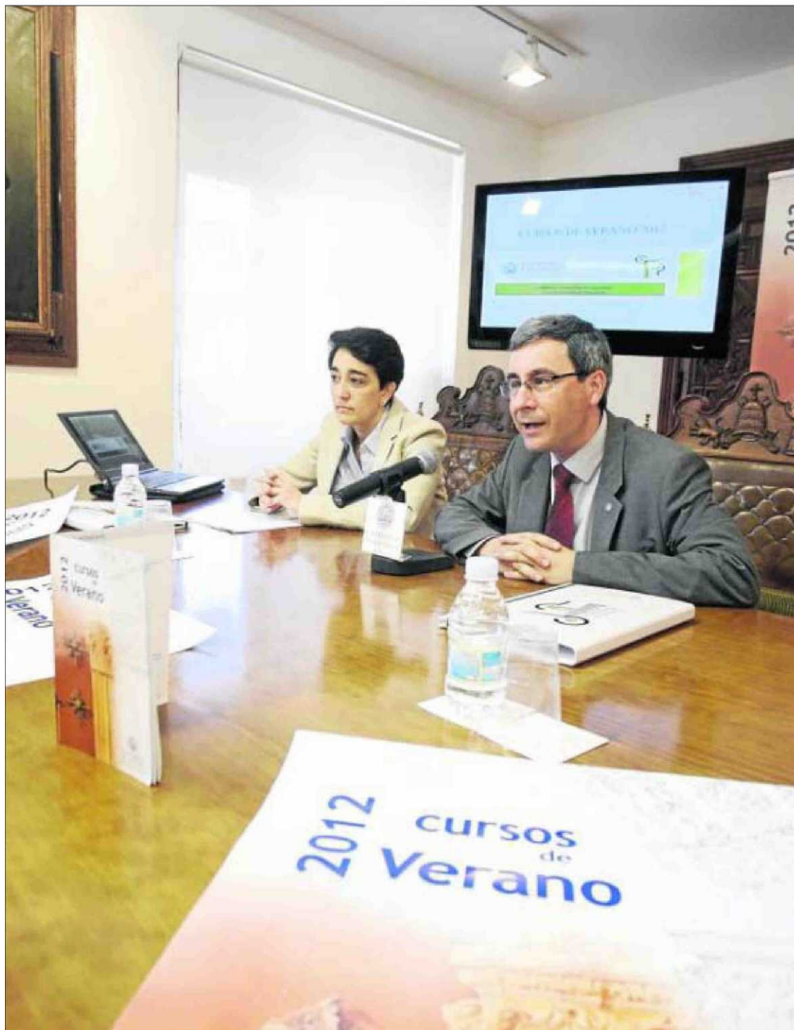
Presentación de los cursos estivales la semana pasada en la Universidad.

LOS CURSOS DE ESTE AÑO INSISTEN EN LA FORMACIÓN PERMANENTE Y EN LAS POSIBILIDADES FORMATIVAS PARA ESTUDIANTES, LICENCIADOS Y PROFESIONALES, QUE TAMBIÉN PUEDEN MATRICULARSE EN CUALQUIER ACTIVIDAD