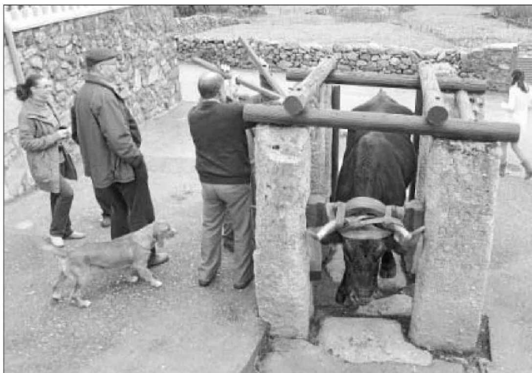
Un momento de la demostración de cómo funciona un potro de herrar vacas en Valdefuentes de Sangusín.

Hay que tener en cuenta que Valdefuentes de Sangusín es un pueblo ganadero, por excelencia, y donde antiguamente había mu-