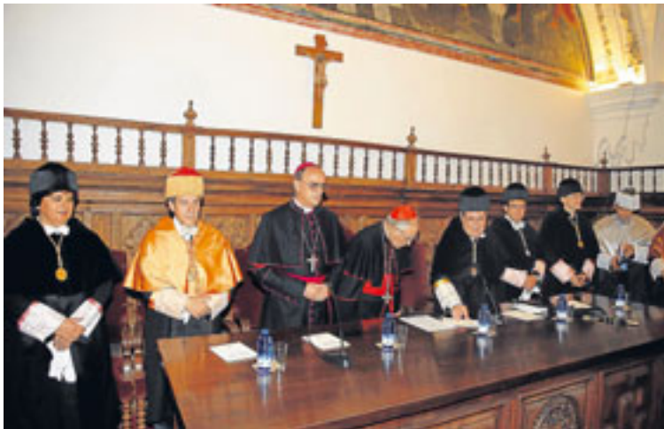
La ceremonia inaugural estuvo presidida por el cardenal Rouco Varela (centro).

En este mismo capítulo, De los Ríos recordó también al Ministerio que en la actualidad la Junta se ve obligada a cofinanciar con 9 millones de euros el programa de becas del propio Ministerio, “ya que están tomando como referencia los precios de hace dos años”, concretó. De ahí el desfase y la queja del Ejecutivo regional.