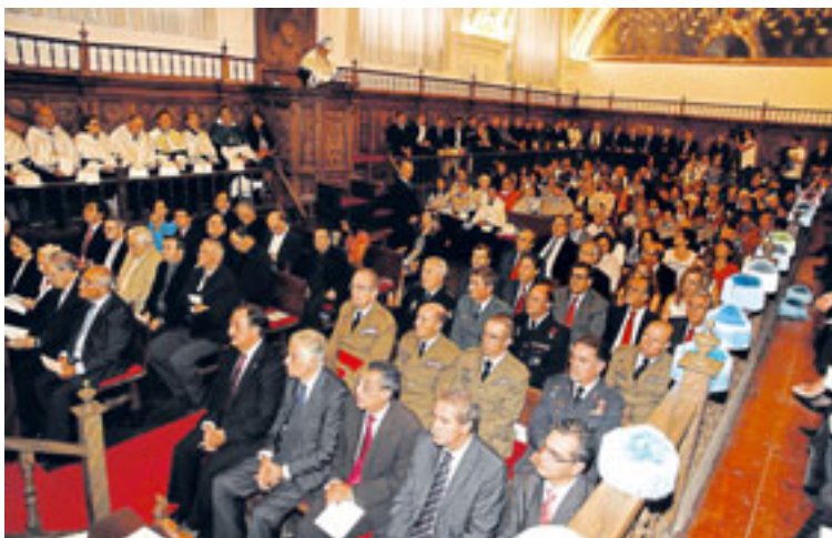
Imagen de los asistentes que llenaron el Aula Magna de la Pontificia.