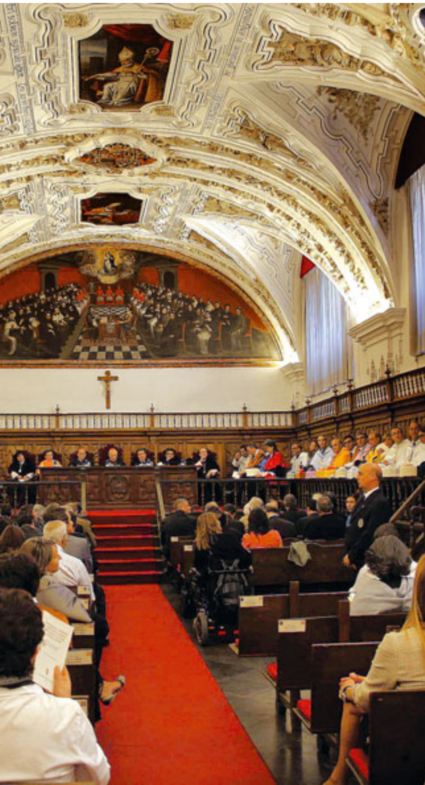
Momento del acto oficial de apertura de curso en la Pontificia.