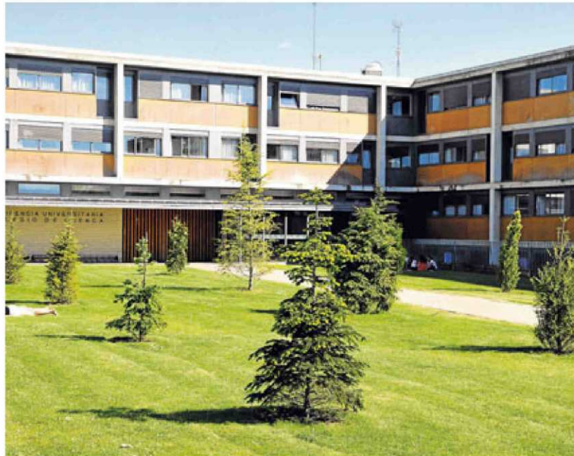
Exterior de la residencia universitaria del Colegio de Cuenca.

Las Batuecas, tercer centro denunciado, se libra de la multa tras darse de alta como alojamiento hotelero