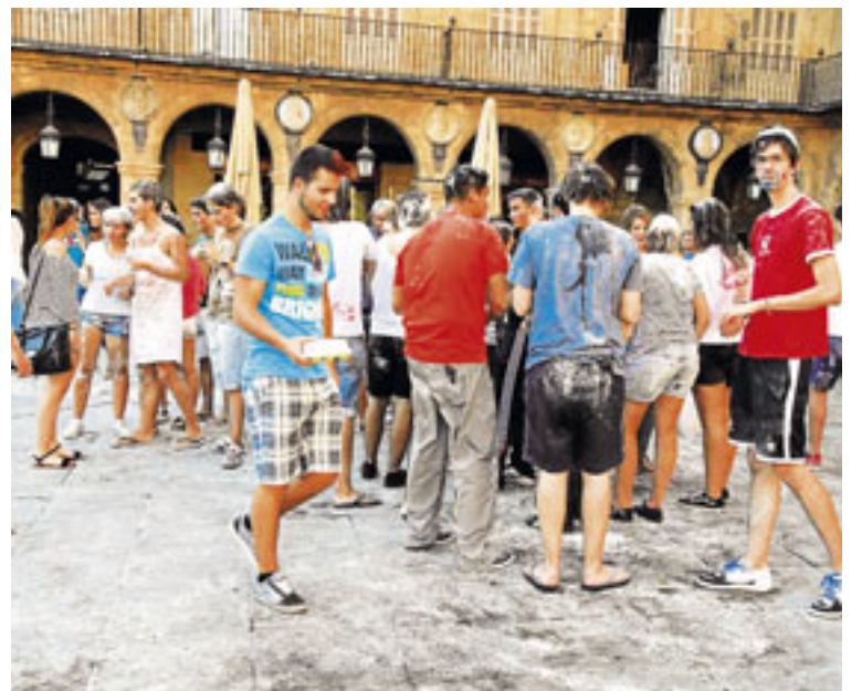
El lunes hubo lanzamiento de huevos y harina en plena ágora./BARROSO

La medida adoptada por la institución salmantina no es la única. Hace unos días, un colegio mayor de Madrid expulsó de forma temporal, durante dos semanas, a cuatro de sus internos, uno de ellos por obligar a beber alcohol a uno de los novatos. De hecho, el colegio mayor que tomó esta decisión es uno de los 125 de toda España que se han comprometido en un manifiesto a realizar acciones para acabar con las novatadas. Además, los firmantes prometen colaborar con otras instituciones de educación superior, padres, universidades, Administración Pública y entidades privadas para prevenir este tipo de comportamientos.