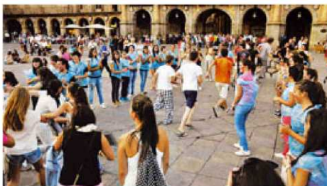
Las novatadas volvieron a repetirse ayer en la Plaza Mayor.