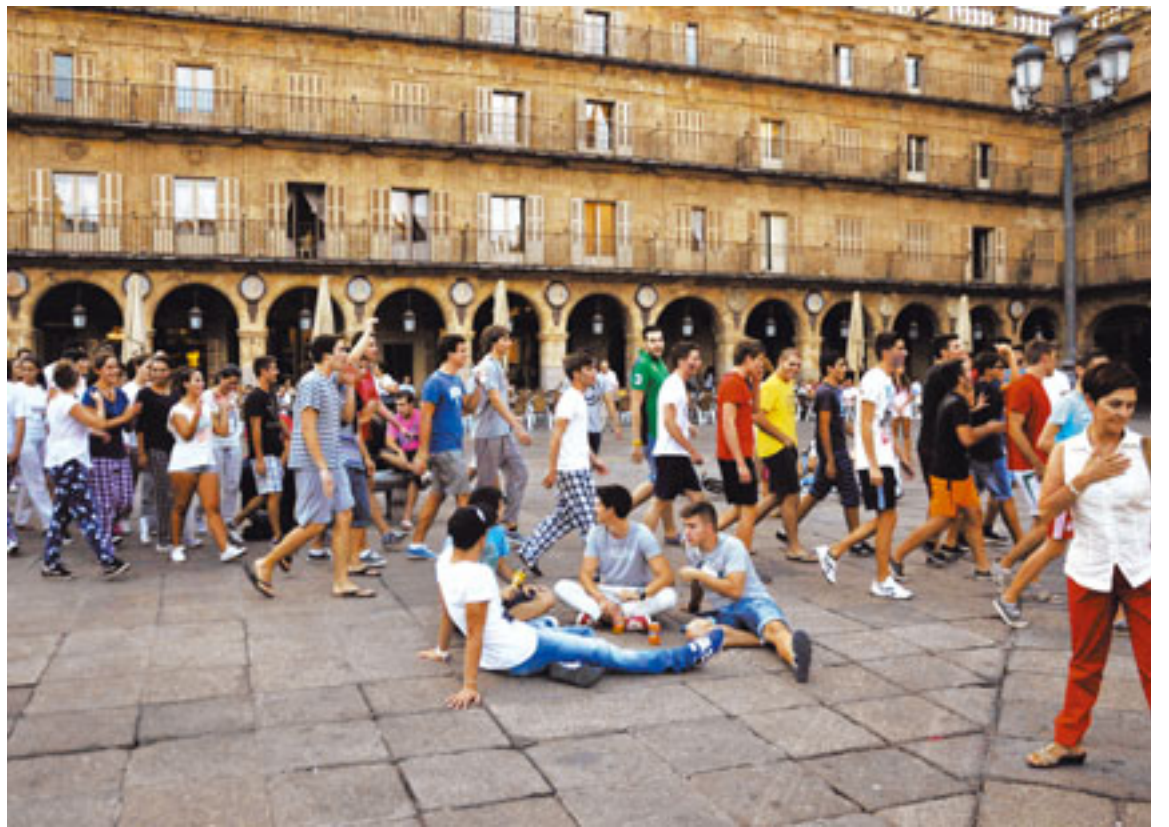
Un grupo celebrando una novatada en la Plaza Mayor, algunos de ellos vestidos con pijama.