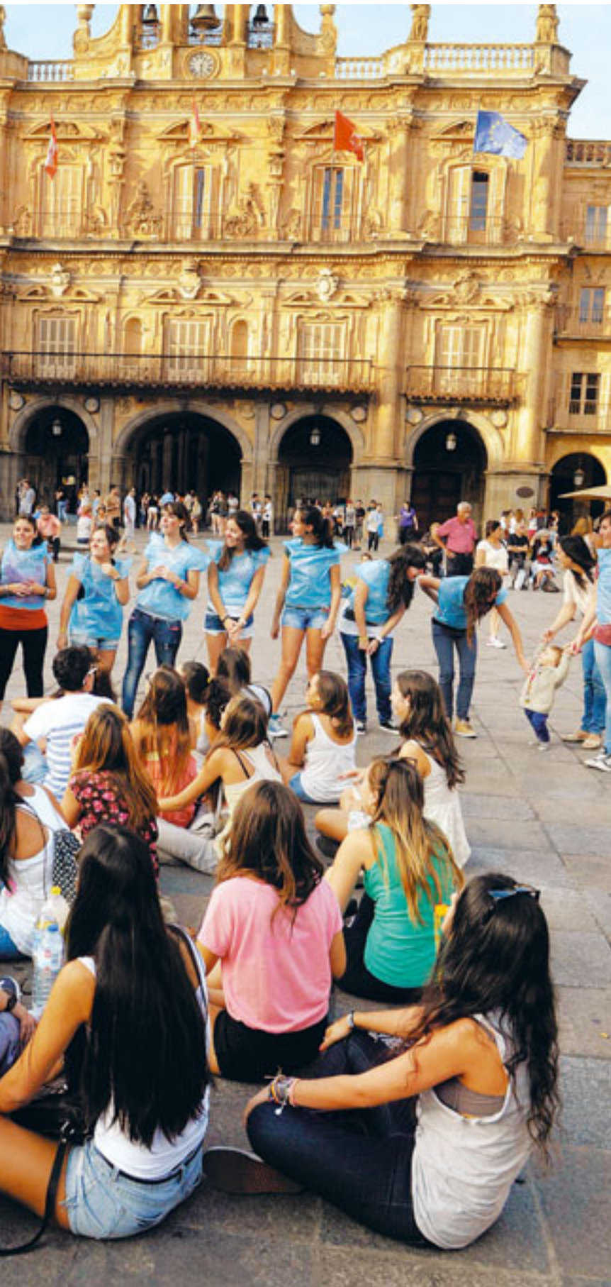
Un grupo de chicas en plena novatada./GALONGAR