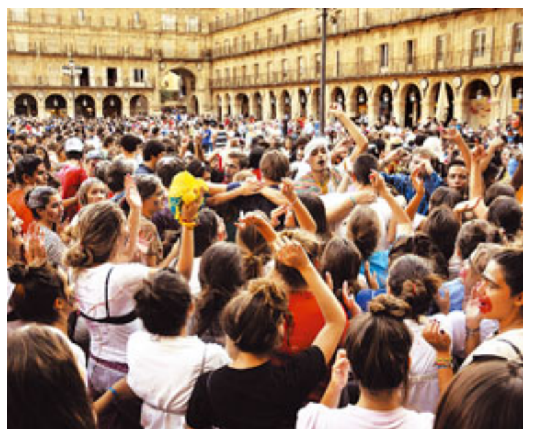
La Plaza Mayor se ha convertido en referencia para las novatadas.