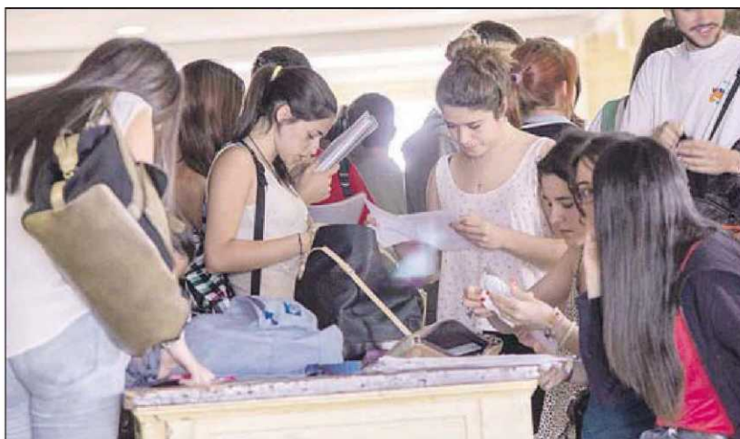
Estudiantes en la Complutense antes de un examen de Selectividad de ayer.