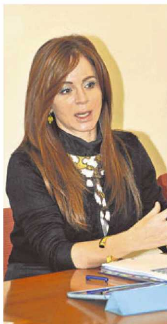
Silvia Clemente. | BARROSO

A través de la Ley Agraria, que se aprobó en las Cortes de Castilla y León en marzo, se va a crear un fondo de tierras disponibles y recursos pastables, al tiempo que se va a dar prioridad a la incorporación de jóvenes y mujeres al campo, una preeminencia que también se va a mantener a la hora de crear industrias agroalimentarias. “Este nuevo marco hasta 2020 tiene que darnos muy buen resultado”, dijo una esperanzada Silvia Clemente. “Se abre un nuevo tiempo. Va a haber un impulso para el campo de Castilla y León y en esta Comunidad Autónoma hemos trabajado mucho para la incorporación de jóvenes y lo vamos a seguir haciendo, pero la despoblación es un problema —o mejor dicho un proceso— estructural, que requiere medidas horizontales desde todas las áreas de gestión y de gobierno. La parte que a nosotros nos toca es muy importante, pero las partes de los demás también lo son”.