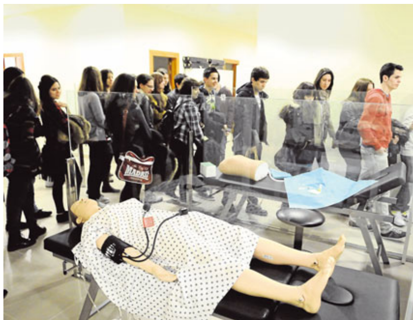
Un grupo de estudiantes visitando la sala de simulación de la Facultad de Medicina.

Ante esta situación, la Conferencia de Decanos considera básico, al menos, que se cumpla el número de plazas que aparece en la memoria de los títulos de grado, tanto en las universidades privadas como en las públicas, y pide al Ministerio de Educación que no se apruebe ninguna facultad nueva. "Sería un despropósito crear nuevas facultades, primero por la