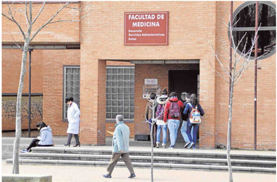
Fachada de la Facultad de Medicina de la Universidad de Salamanca, situada en el Campus Unamuno.

Pese a estos buenos datos, el decano de Salamanca se muestra prudente al igual que la Conferencia de Decanos, que prepara un estudio para conocer de forma más exhaustiva el modo de proceder de los estudiantes al solicitar el acceso a los grados.