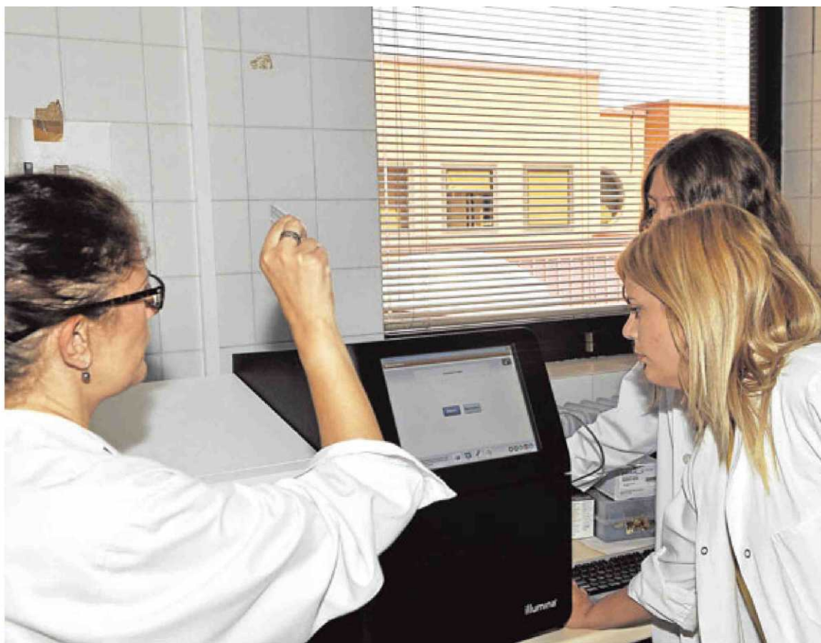
Tres investigadoras salmantinas cotejan datos en un laboratorio de la Facultad de Medicina de la Universidad de Salamanca.