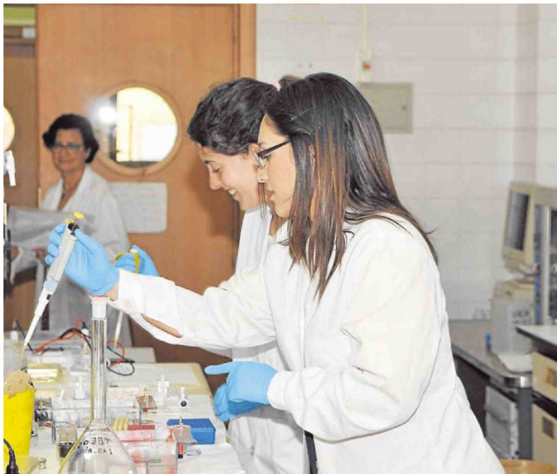
Dos investigadoras trabajan en un laboratorio del IBSAL.

Además de la fuente de financiación europea, el IBSAL