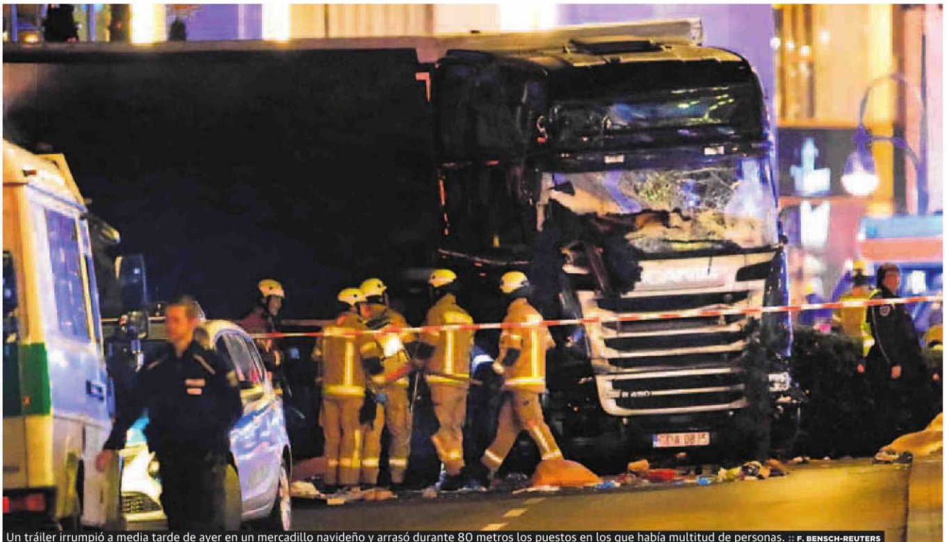
Un tráiler irrumpió a media tarde de ayer en un mercadillo navideño y arrasó durante 80 metros los puestos en los que había multitud de personas.