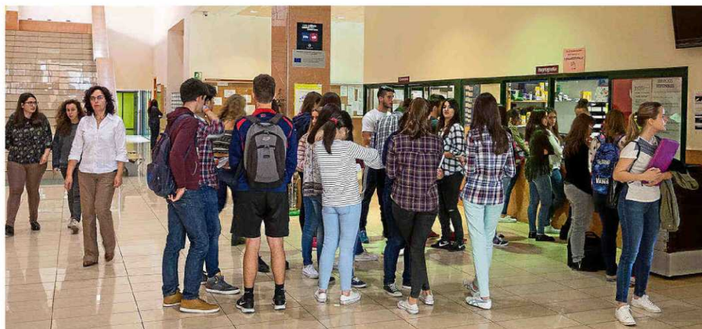
Alumnos, en una de las facultades del Campus Miguel Delibes de la Universidad de Valladolid.

Son las carreras de Ciencias de la Salud las que exigen una nota más elevada. El 89% de los que accedieron acreditaron un notable. A continuación, las de ciencias, con un 69%.