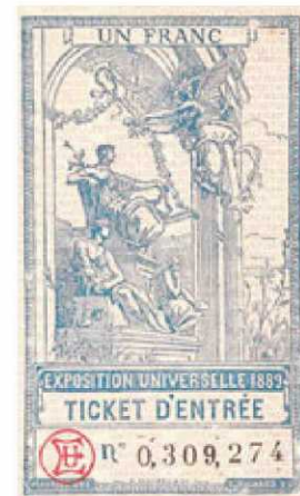
Entrada a la Exposición Universal.

Pollux Hernández: “El libro va a gustar a todos: al lector habitual de Unamuno y también a los amantes de los viajes”