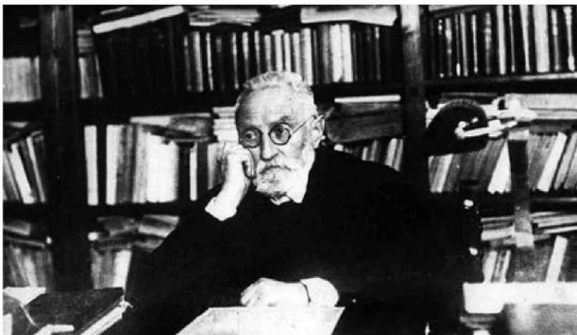
Imagen de Miguel de Unamuno en la biblioteca de su casa de Salamanca siendo rector de la Universidad.

Contenido. El manuscrito ocupa dos cuadernos, con un total de 365 páginas, escritas la mayoría en tinta negra, algunas en azul y, otras, sobre todo al final, a lápiz. “Pero no es solo el conti-