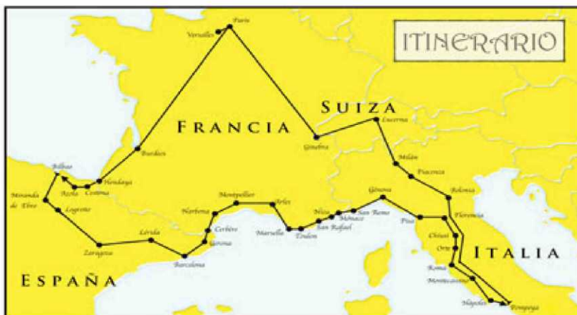
Recreación del viaje que Unamuno realizó en 1889, con 25 años, por Francia, Italia y Suiza.