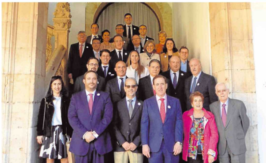
Foto de grupo de la primera reunión del consejo asesor de Alumni Universidad de Salamanca acompañados de la junta directiva.

Charlas, debates, presentaciones, foros de empleo, descuentos en cursos... Las actividades y ventajas de formar parte de Alumni-USAL son múltiples. Alumni-USAL es ya una gran red global que sirve de apoyo a sus miembros a la vez que se constituye como un vehículo de todos los que quieren colaborar con la proyección y el respaldo a la institución académica superior.