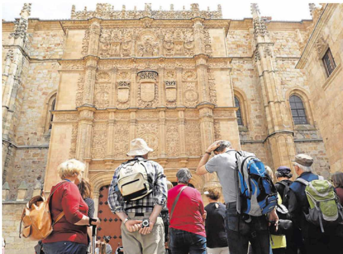
Fachada del edificio de las Escuelas Mayores de la Universidad de Salamanca.