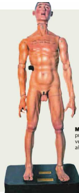
Maniquí. Para prácticas de vendajes, año 1570.

La Universidad de Salamanca, la más antigua de España, cumple ocho siglos como templo del saber al servicio de la cultura y la historia