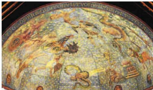
El cielo de Salamanca. Mural de Fernando Gallego.

Durante siglos, pero sobre todo a partir de los Reyes Católicos, la Universidad de Salamanca fue el lugar en el que se formaba la élite del país. Desde la Edad Media existía una cátedra de Medicina y a finales del XV se creó la de Astronomía (el célebre 'Cielo de Salamanca', obra de Fernando Gallego, era en realidad un material didáctico). Pero lo más relevante estaba en otras disciplinas: son los años en los que sus canonistas participan en primera línea en los