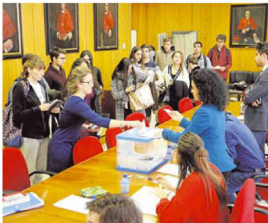
Estudiantes depositando sus papeletas en la Facultad de Derecho.

Hasta el mediodía hubo un gran movimiento en las aulas en las que votó el profesorado y el personal de administración y ser-