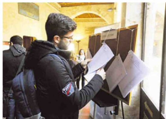
Un joven consultando el censo a la puerta del Edificio Histórico.