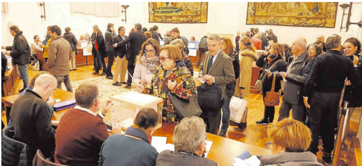
Mucho ambiente a primera hora de la mañana en el Aula Salinas donde votó el profesorado.