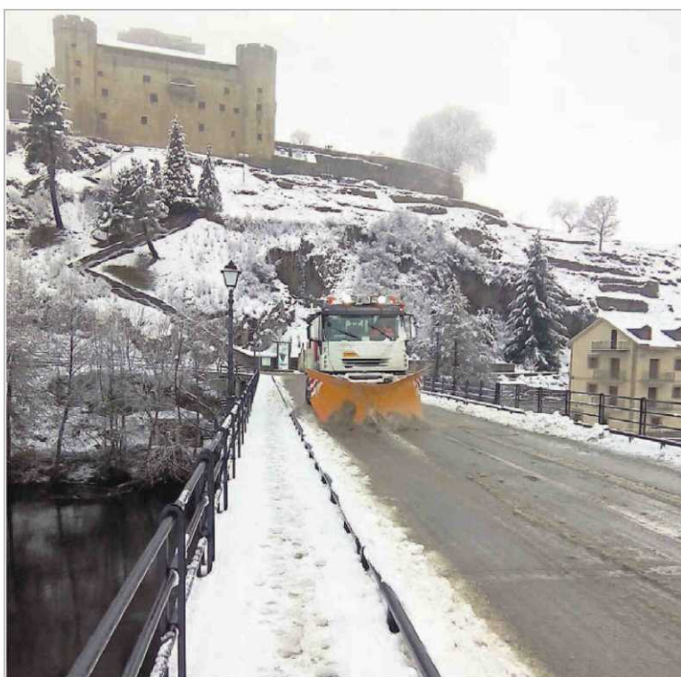
Una máquina quitanieves trabaja en la carretera de acceso a Puebla de Sanabria.