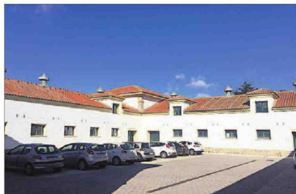
Vista exterior de las instalaciones.