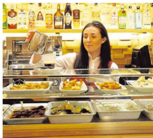
Una camarera sirve un café en un establecimiento salmantino.