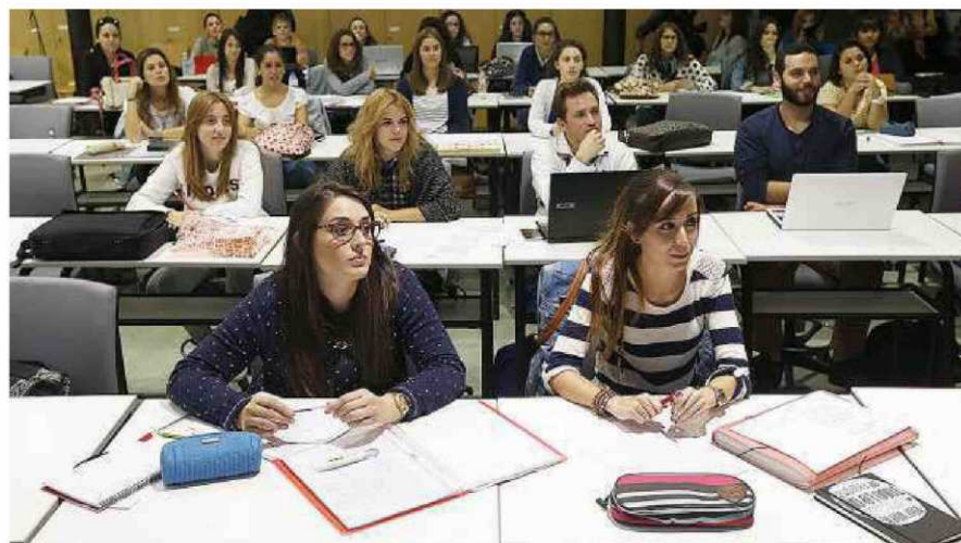
Un grupo de alumnos atiende durante una clase de un máster.

Además, destaca la fuga de universitarios en dirección Madrid para cursar estos estudios de postgrado porque, como reconoce Garcés, no es tanto por la oferta educativa sino que lo hacen por las «mejores salidas laborales y las prácticas en empresas». Según los datos de este informe, a los que ha tenido acceso este periódico, de los 7.360 alumnos que en el curso 2015 - 2016 cursaban un máster en Castilla y León, casi el 60%, casi 4.300, procedían de