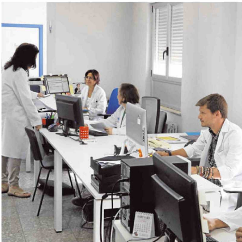
Profesionales de la Unidad de Gestión del IBSAL. | ALMEIDA

El IBSAL planea estar presente dentro en diversos comi-