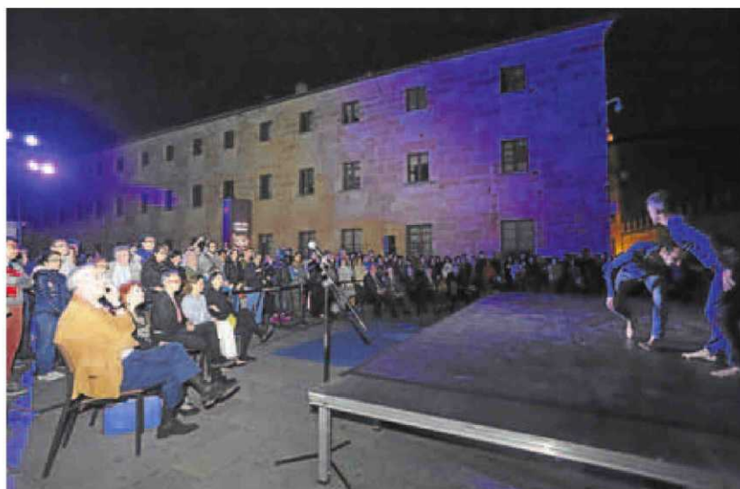
Numeroso público se acercó a la USAL para ver los actos con motivo del Día de Europa.

En declaraciones a los periodistas antes de pronunciar una conferencia en el Paraninfo de la Universidad de Salamanca sobre su libro 'Mi camino de Santiago', dentro de los actos con motivo del Día de Europa, Villa (Madrid, 1978) calificó el acto de la pasada semana de la diso-