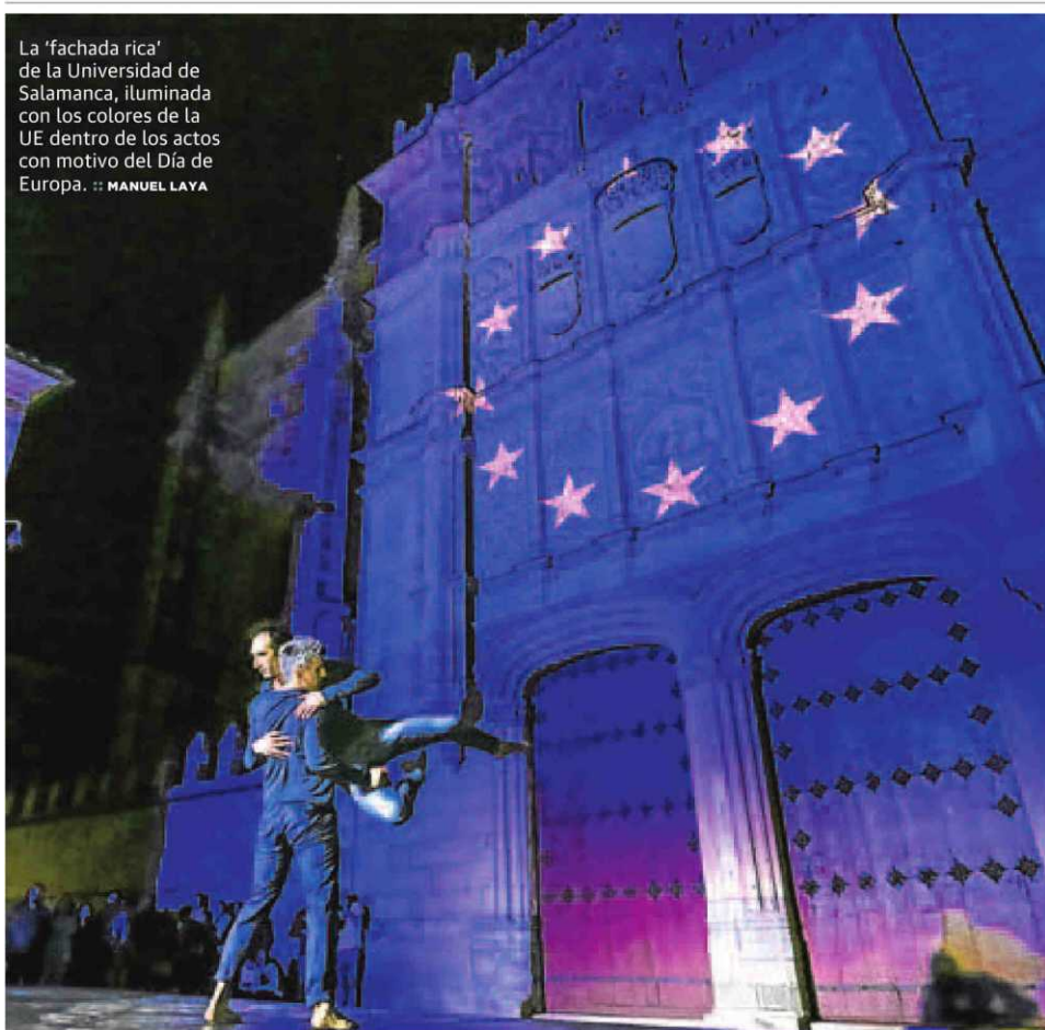
La 'fachada rica' de la Universidad de Salamanca, iluminada con los colores de la UE dentro de los actos con motivo del Día de Europa.

el PSOE tras comprobar que en la veintena de proyectos ferroviarios, algunos ya en marcha, que propone la empresa dependiente de Fomento hasta 2025 no hay ninguno para Salamanca. P2