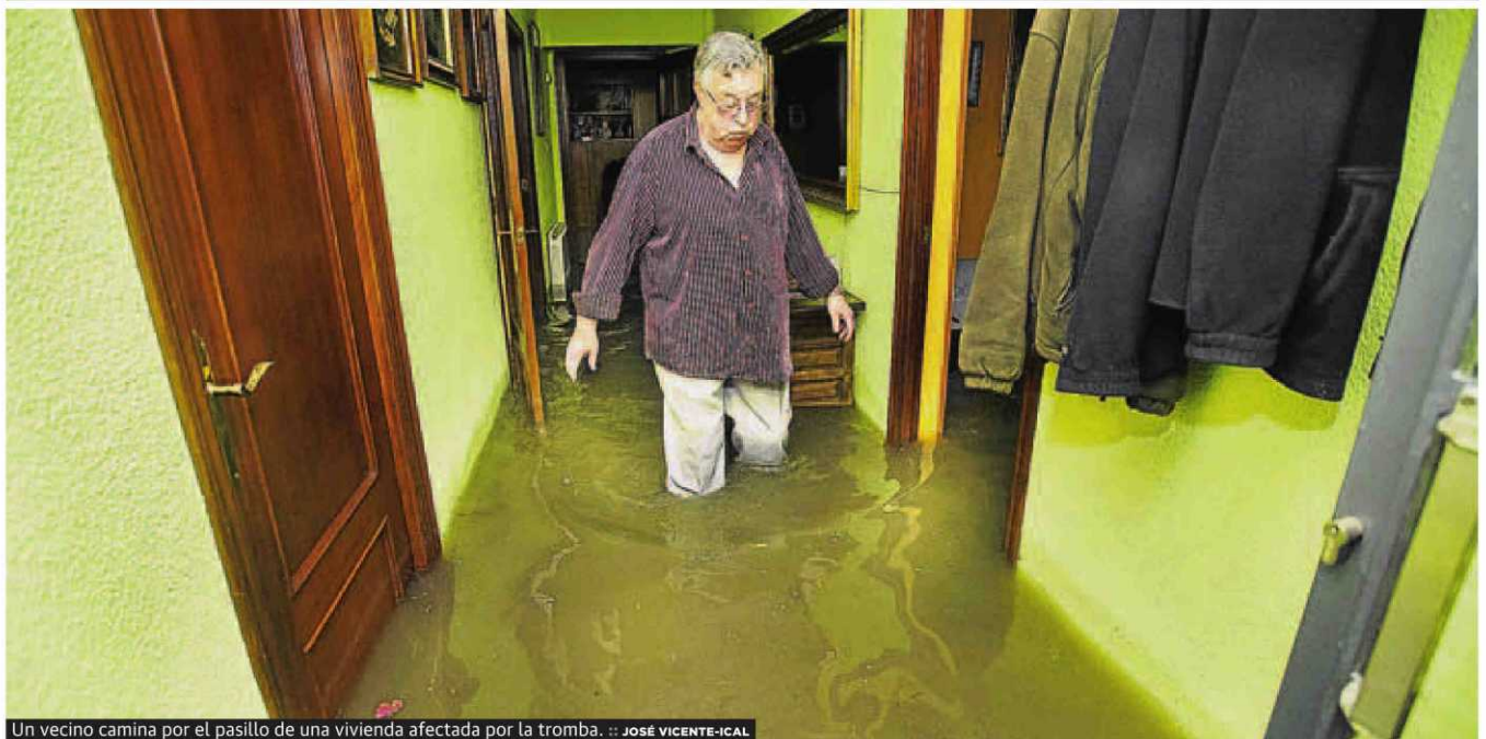
Un vecino camina por el pasillo de una vivienda afectada por la tromba.

ministros de América Latina. Sus profesores admiten que los partidos españoles no se han interesado por el máster y piden «voluntad política» para aplicar las normas anticorrupción de forma eficaz. Consideran «clave» que la ciudadanía confíe en ellas para denunciar las corruptelas. P2