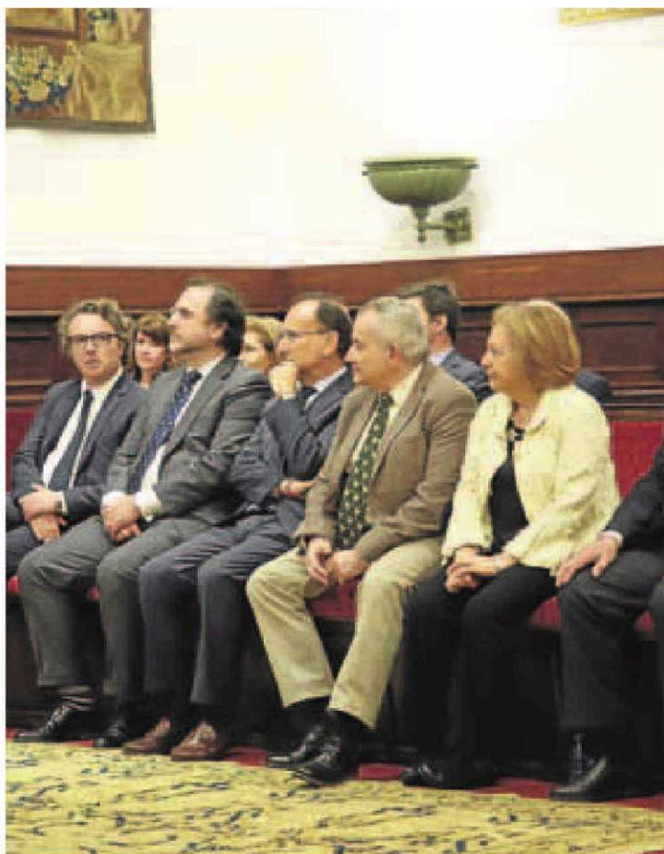
Responsables de los archivos seleccionados por la Unesco.

Además, el Ministerio de Educación entregó ayer en el Paraninfo los diplomas acreditativos de la inclusión en el Registro Internacional de la Memoria del Mundo de la Unesco, del Archivo General de Simancas y del Códice Calixtino de la Catedral de Santiago de Compostela, junto a las copias existentes en la Biblioteca