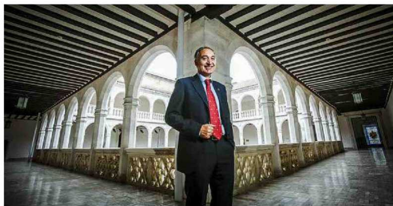
El nuevo rector de la UVA en el patio del Palacio de Santa Cruz. J. I. TAJES

¿Cómo se generará la marca de la UVA, una de sus principales promesas de campaña?