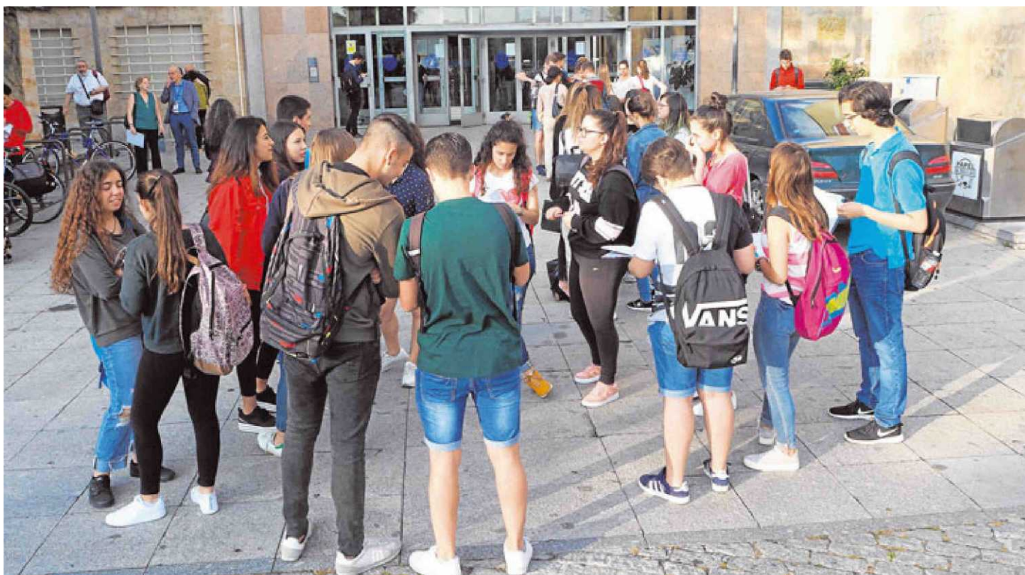
Estudiantes a las puertas de la Facultad de Ciencias minutos antes de iniciar la Evaluación de Bachillerato para el Acceso a la Universidad.