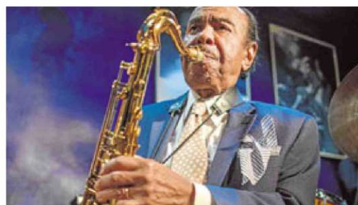
El legendario Benny Golson se subirá el viernes al escenario salmantino.