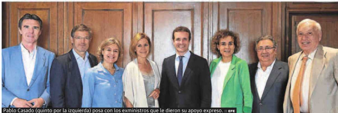
Pablo Casado (quinto por la izquierda) posa con los exministros que le dieron su apoyo expreso.