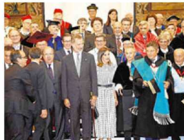
Conmemoración de los 30 años de la Magna Charta.

tentes del mundo, ubicado en el Parque Científico de Villamayor. Todo un ejemplo de innovación, cuestión que el Rey animó a impulsar a la Universidad de Salamanca, así como a continuar promoviendo su vocación internacional. La jornada concluyó, ya sin los Reyes, con un desfile histórico de más de 400 rectores y representantes académicos por el centro de la ciudad, la materialización de la simbiosis entre la Universidad y la ciudad de Salamanca.