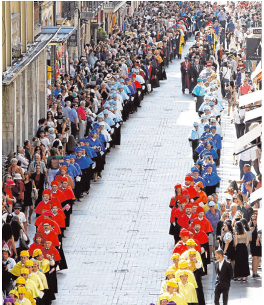
Histórico desfiles de rectores y doctores de la Universidad por la Rúa Mayor.