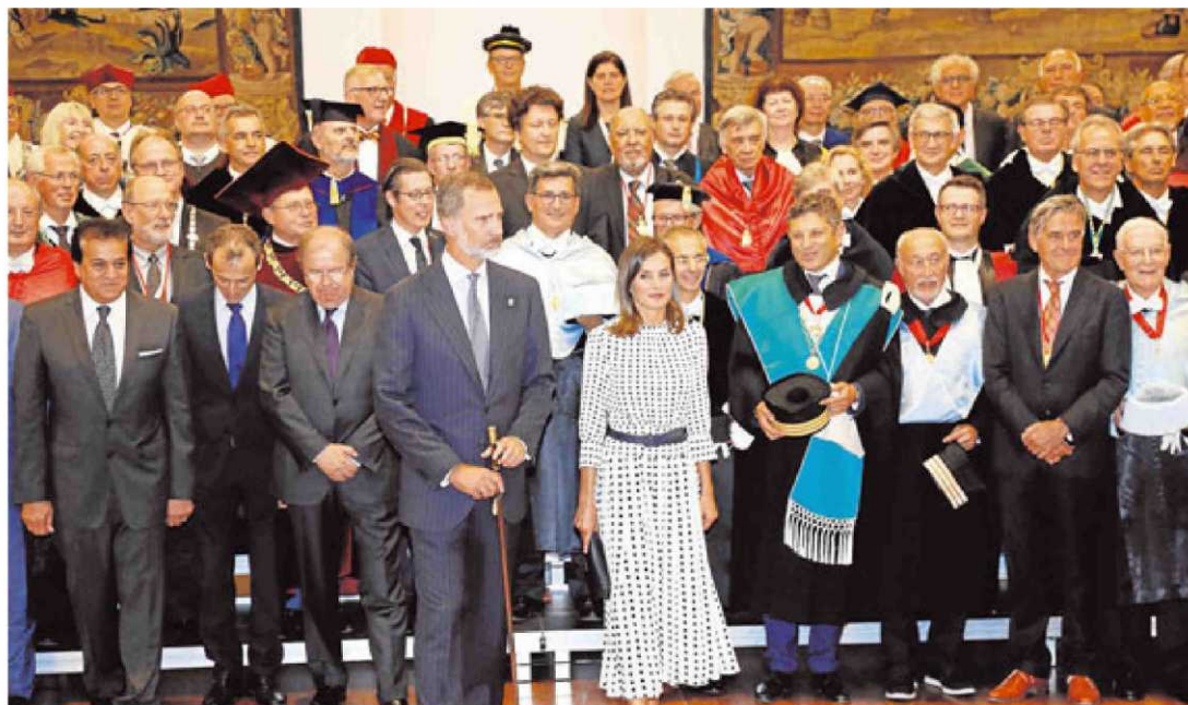
Los Reyes con el rector, el presidente de la Junta, el ministro de Ciencia y los representantes universitarios de la Magna Charta.

Ayer la protagonista fue la Carta Magna de las Universidades. “Estoy seguro de que los principios de la Magna Carta inspirarán los frutos del VIII Centenario de la Universidad de Salamanca”, afirmó Su Majestad. “Ahora y en el futuro, nos moverán la capacidad crítica, la unión entre docencia e investigación, la libertad y la interacción de culturas. Todas estas