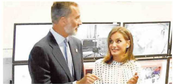
La Reina mira a Felipe VI durante uno de sus comentarios en el Centro del Láser.