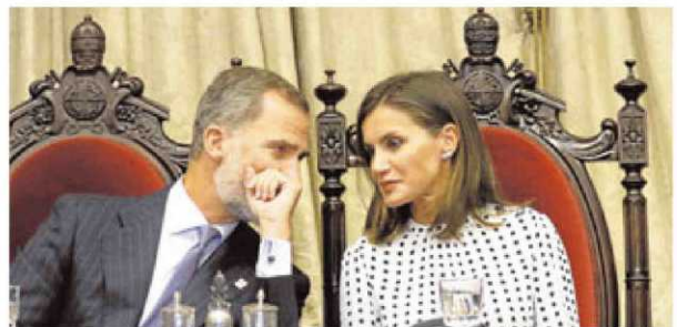
El Rey se tapa la boca para hacer un comentario a Letizia en el Paraninfo.

fue muy aclamado por los asistentes, muchos de ellos muy vinculados con la ciencia y la innovación.