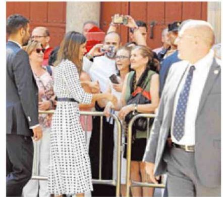
Letizia, muy cercana también en el Patio de Escuelas.