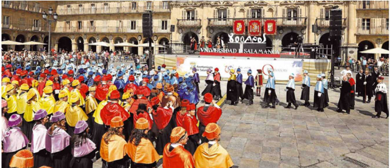
Recepción a la histórica comitiva de 250 rectores y 200 doctores de la Universidad en la Plaza Mayor.