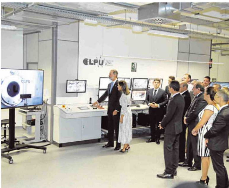
El Rey accionando el botón que dispara el láser de petavatio bajo la atenta mirada de la Reina y las autoridades.