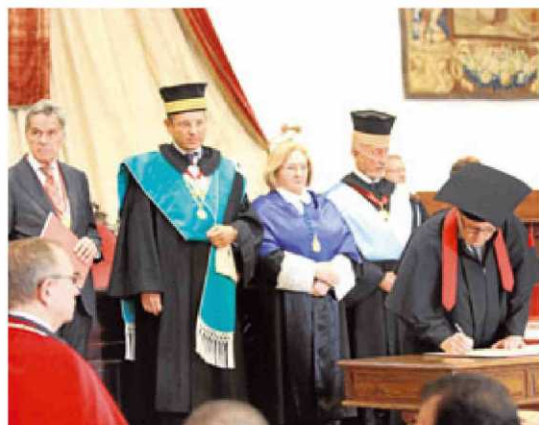
Adhesión de nuevas universidades a la Magna Charta.

El regidor de la “ciudad universitaria por excelencia” destacó la “sólida unión” entre ambas instituciones desde hace ocho siglos