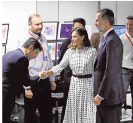
Reverencia de un trabajador del Centro del Láser a la Reina.