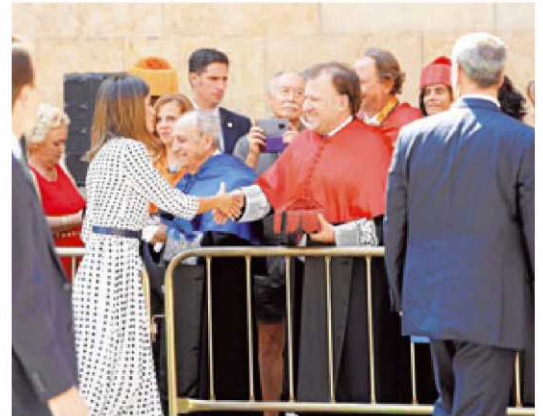
Mucho cariño para la Reina Letizia de la comunidad universitaria.