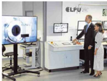
El Rey acciona el botón que dispara el láser.

La alianza entre la Corona y la Universidad de Salamanca se ha intensificado con motivo del VIII Centenario del Estudio. Una vez más, y ya suman cinco en un año, los Reyes de España respondieron a la llamada de la institución académica y presidieron los actos de conmemoración de los 30 años de la Magna Charta Universitatum, documento que recoge los principios básicos de las universidades. Antes, Sus Majestades fueron los encargados de inaugurar el láser de petavatio, un equipo único en España y entre los diez más po-