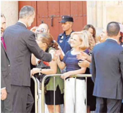
Felipe VI saluda a una mujer en el Patio de Escuelas.