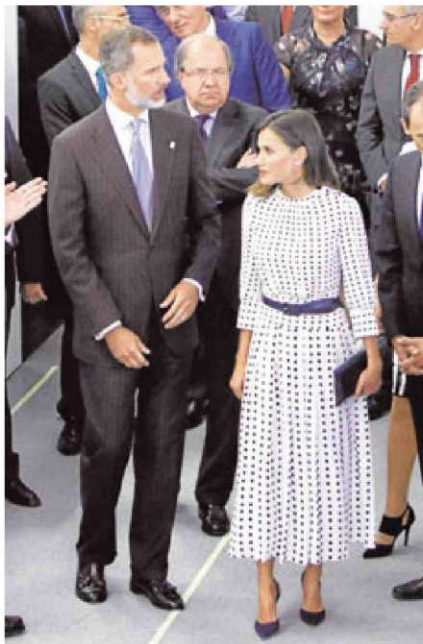
El Rey con traje a rayas y la Reina con el "Massimo Dutti".