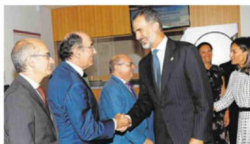
Su Majestades saludando al presidente de Iberdrola y al de la Diputación.