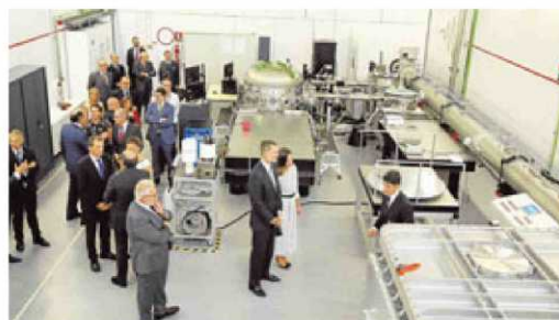
Felipe y Letizia en el búnker en el que desemboca el láser.