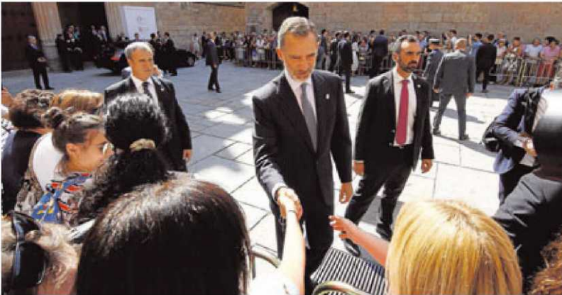
El Rey Felipe VI recibió un baño de masas en el Patio de Escuelas.