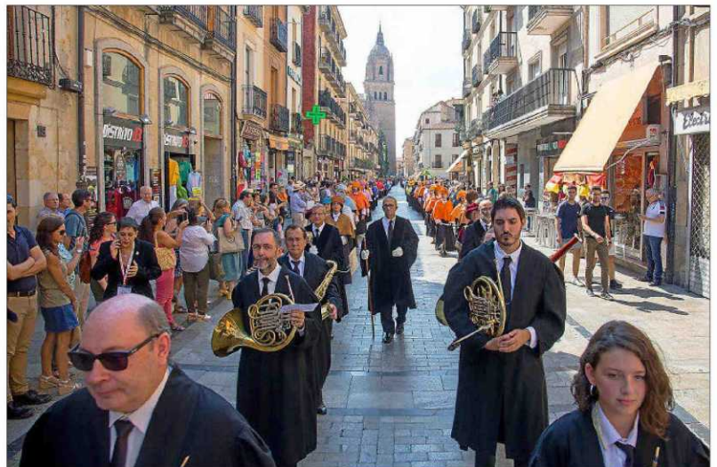
Cientos de rectores de universidad recorrieron las calles de Salamanca.

Su instalación, montaje y operación se fue desarrollando por fases para mantener el control de la calidad del haz de luz en todo momento. Con esta nueva convocatoria, se pone así fin a la fase de construcción y el CLPU se puede considerar un centro totalmente operativo.