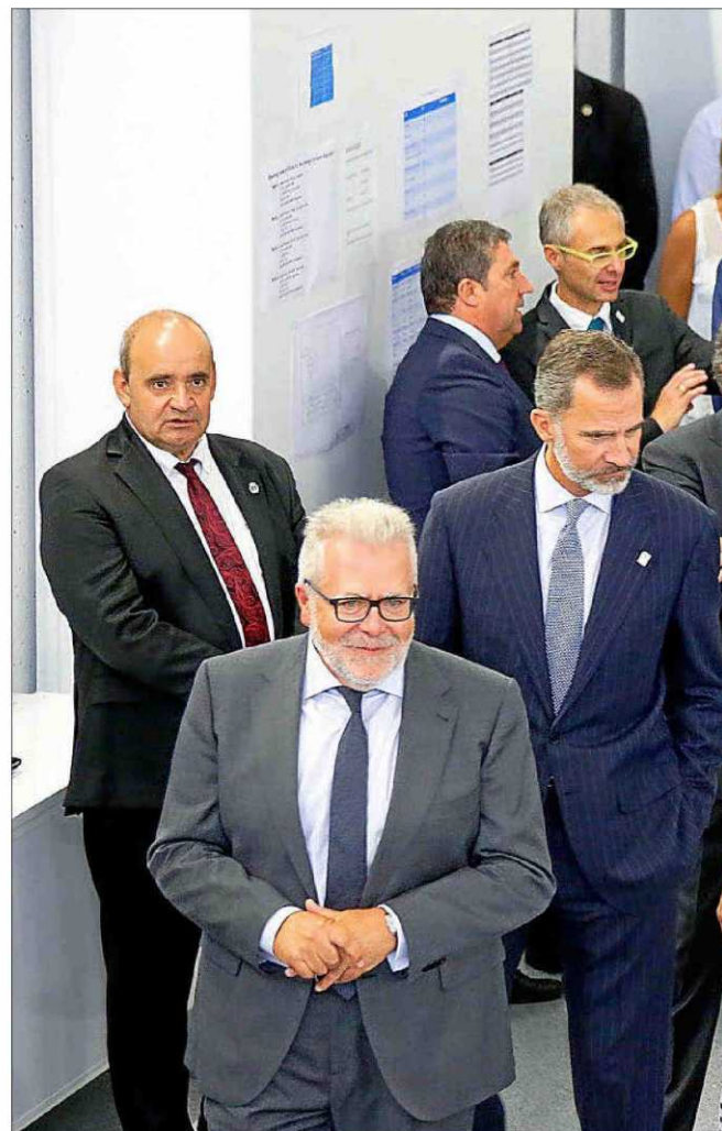
Felipe VI y la reina Letizia, junto a Pedro Duque, Juan Vicente Herrera e Ignacio S. Galán.