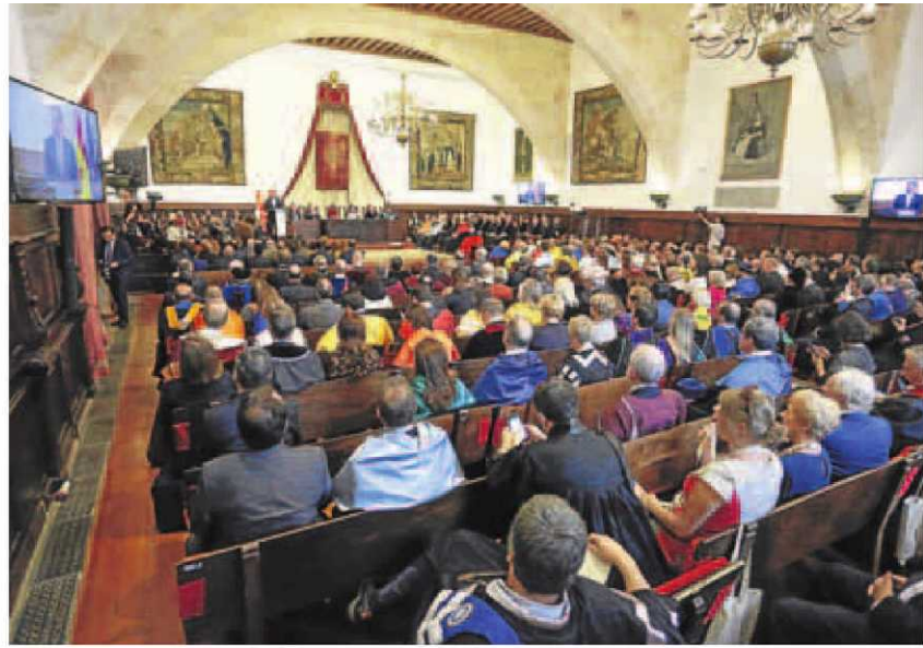
Los asistentes en el Parainfante de la Universidad de Salamanca.

Juan Vicente Herrera Pte. Junta Castilla y León «La Universidad son la forja del desarrollo cultural, científico y técnico»