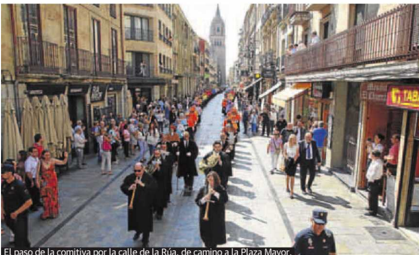
El paso de la comitiva por la calle de la Rúa, de camino a la Plaza Mayor.

debe llamar universidades «a organizaciones puramente mercantiles, comerciantes de títulos sin escrúpulos en cuanto a su calidad o rigor científico». Porque Rivero cree que allí donde no se cultive el auténtico esfuerzo por aprender y enseñar, «no debería aparecer ni reconocerse el nombre de Universidad». En este sentido, considera que hay que ser exigente con la vocación internacional: «Las casas de estudios superiores hemos de colaborar más allá de nuestras fronteras», porque tanto la movilidad