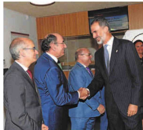
El presidente de Iberdrola, Ignacio Sánchez Galán, saluda al Rey.