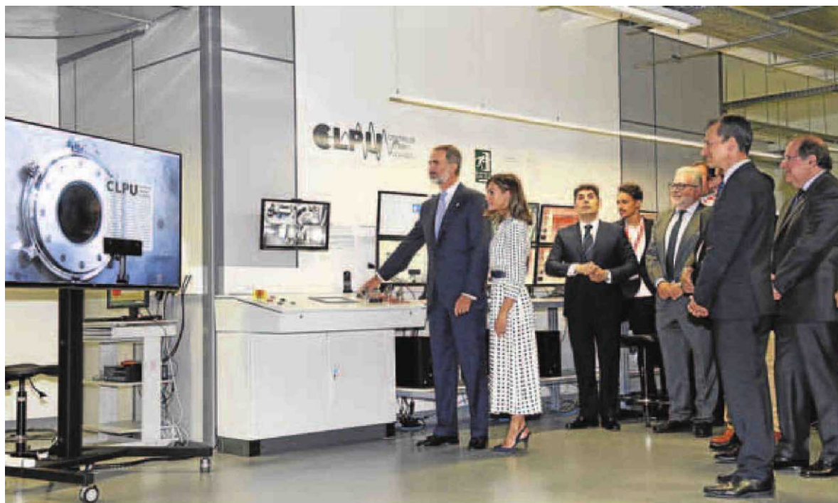
El Rey Felipe VI, en el momento en el que acciona el botón del láser de petavatio VEGA-3.

«Mucha cantidad de energía en un periodo muy corto»