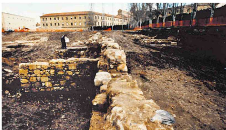
Los restos arqueológicos encontrados en el solar del Botánico en el año 1988.