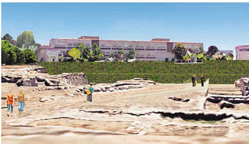
Imagen virtual de cómo quedará el solar tras la intervención municipal para recuperar y abrir a las visitas el espacio del antiguo Botánico.

En total, 776.000 euros de inversión que asumirá el Ayuntamiento el próximo año aunque no descarta el apoyo privado.