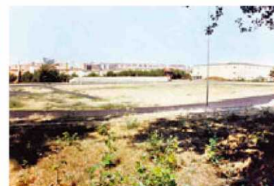
Una de las últimas imágenes de las pistas de atletismo.