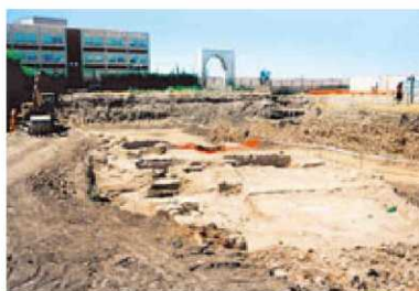
Inicio de las obras del aparcamiento.