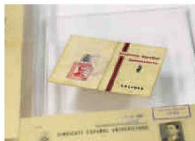
Carné del Sindicato Español Universitario de Falange.