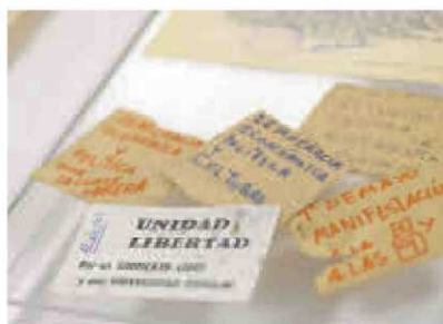
Material requisado en las revueltas de mayo del 69.