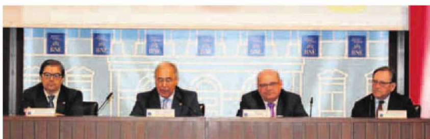
Los representantes de la CRUE, durante la presentación del informe.

En lo tocante a la relevancia de esas publicaciones, las públicas consiguen indexar sus artículos científicos en el primer cuartil (el de más valor dentro de las revistas científicas). Todas ellas sitúan entre el 45% y el 53% de sus investigaciones en ese rango de privilegio, algo que en las privadas solo alcanza la IE. La Universidad Europea Miguel de Cervantes logra un 28,9%.