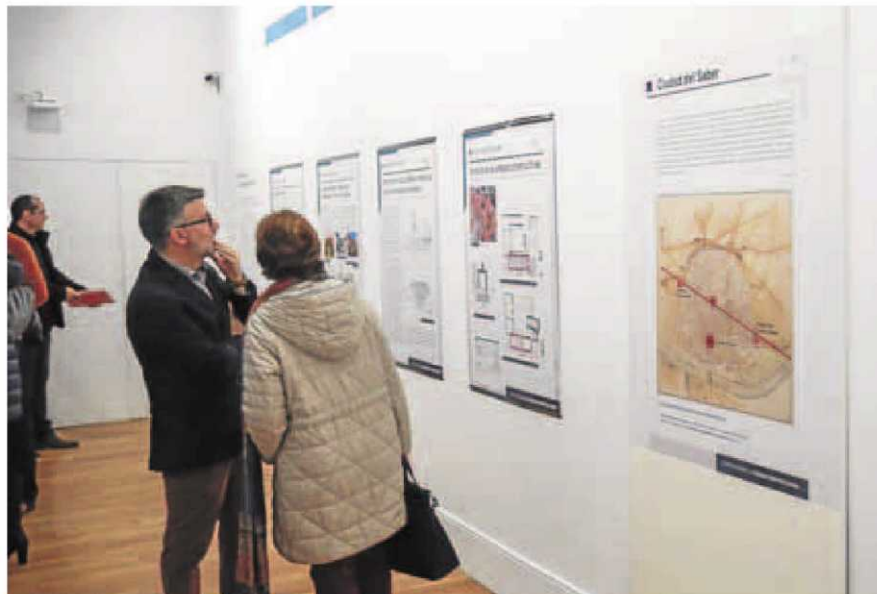
La exposición se compone de una treintena de paneles informativos.