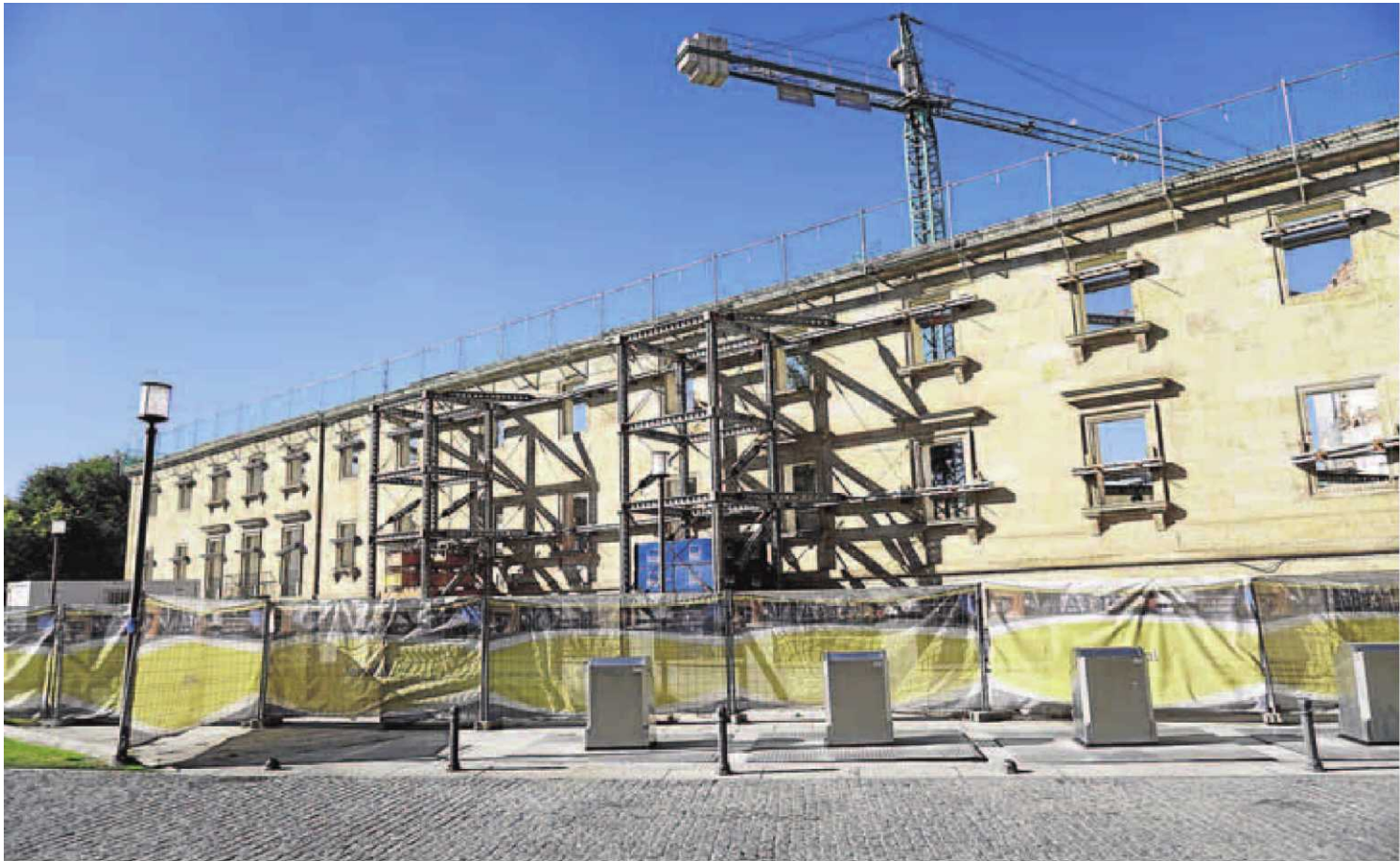
Imagen de las obras de remodelación del antiguo Colegio San Bartolomé para convertirlo en la futura sede de los Cursos Internacionales de la Universidad.